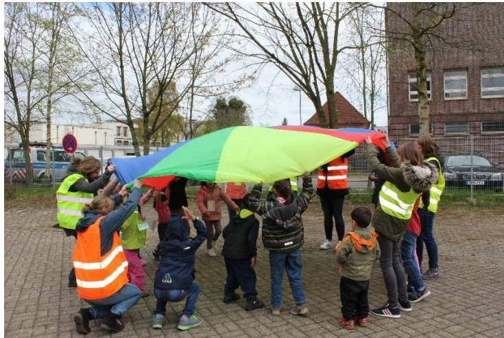
Aktion im April 2016 beim ehemaligen Kreiswehrrersatzamt